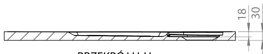
PRZEKRÓJ H-H SKALA 1 : 10