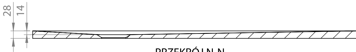
PRZEKRÓJ N-N SKALA 1 : 10